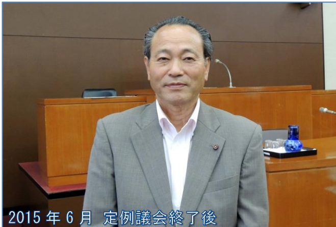
2015年6月 定例議会終了後

早いもので前回の選挙から間もなく4年が経過しようとしています。今回は、災害ガレキ処理・危険家屋解体等の問題で特別委員会を開催したこともあり大変忙しい4年間となりました。