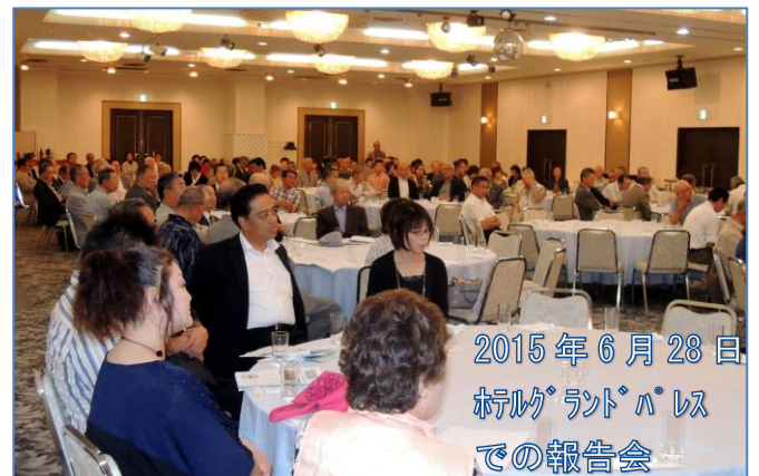
2015年6月28日 ホルムランドパレス での報告会

平成26年6月定例議会で副議長に就任致しました。副議長として必要な仕事は全て問題無くなしました。まだ、任期の9月10日までは副議長としての仕事も続きますのでしっかりと努めて参りたいと思います。