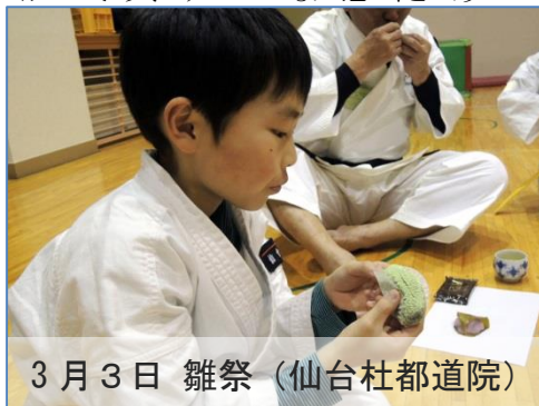
3月3日 雛祭(仙台社都道院)

この平常心を保つうえで、呼吸が大きくかかわっており上がった場合は、呼吸が乱れ、浅く、早くなり心臓の鼓動も早まります。反対に呼吸を整えることにより心身とも安定し、平常心を保つことが出来るのです。