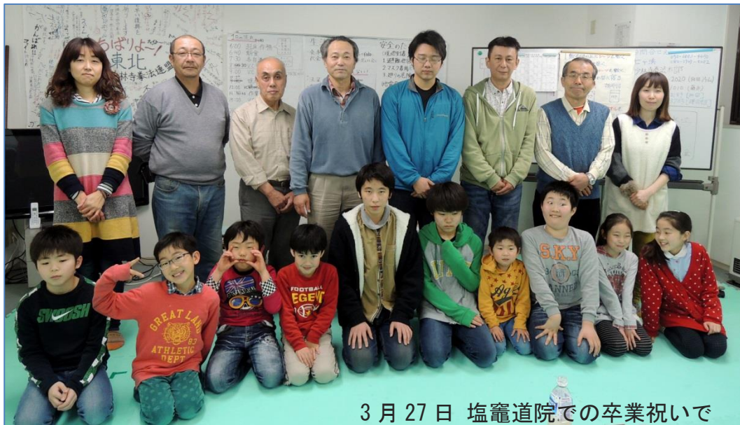
3月27日 塩竈道院での卒業祝いで