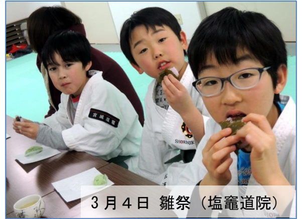
3月4日 雑祭(塩竈道院)

鎮魂行そのものが平常心を保つ動作になるのです。これから何かを行おうとする場合、座禅を組む訳には行かないでしょう。その場合は、椅子に座り背筋を伸ばし深い腹式呼吸を行うとよいでしょう。 平常心を保つ必要がある重要な場面で、忘れず試してみましよう。